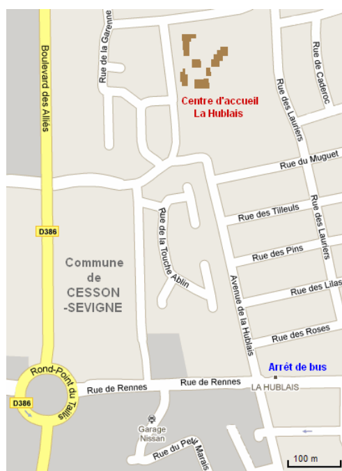
La Hublais - Plan de quartier

Pour des informations sur les transports en commun de l'agglomération rennaise : http://www.star.fr/