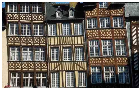
Rennes - Place Sainte Anne

Nous serons ainsi en "pays breton" puisque RENNES, chef-lieu du département d'Ille-et-Vilaine, est aussi la préfecture de la Région BRETAGNE.